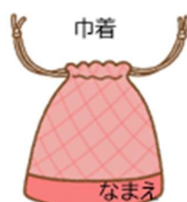
スプーン・フォーク・お箸セット