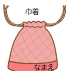
歯ブラシ・コップ